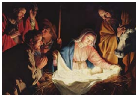
Gerhard van Honthorst (1590-1665).

K rybben settes opp til første søndag i advent i Fjell kirke. Den har vært en fast del av vår julefeiring like lenge som Fjell kirke har stått. Stallen med dyrene, krybben, familien, hyrdene og stjernen er hos oss. Julekrybben er noe vi kjenner og gleder oss over. Adventstiden er stappfull av forventning, lys, hygge og varme. Ingen av oss kan unngå å bli preget av alle tegnene som minner oss om at vi er på vei inn i den mest stemningsfulle og strålende høytid i året.