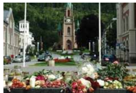
Blomsterhav på Bragernes torg.

På tross av mange sterke møter med sørgende pårørende og nære venner i bunnløs sorg og smerte, er det noe annet som står igjen. Det er erfaringen av det vår kjære Kronprins Haakon så vakkert sa under rosemarkeringen i Oslo: -I kveld fyller kjærligheten våre gater! I stedet for uro, protestskrik og jakt på sydebukker, sto alle opp for å vise medfølelse, kjærlighet og omsorg. Da folkehavet løftet rosene til hilsen, var det et ubeskrivelig vakkert syn. Alle som var med på rosetoget i Drammen – og på så mange andre markeringer,