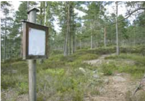
Gravrøys på Kirkåsen.